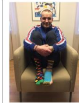
Islandes Valsts prezidents Guðni Torlácjús Jóhannesson Dauna sindroma dienā 2017. gadā.

Skolotājs aicina skolēnus uzdot jautājumus, atbild uz tiem.